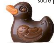
Praliné avec éclats de pistaches