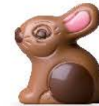
Praliné et riz soufflé

Les ballotins se présentent en 3 DÉCORS ASSORTIS**