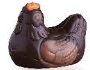
Caramel tendre d'Isigny