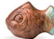
Praliné et noix de coco caramélisée