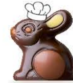
Praliné noisettes moelleux