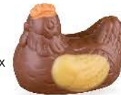
Duo praliné et caramel